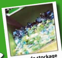
Centre de stockage des matériaux