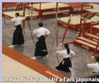
Le kyūdō : l'art du tir à l'arc japonais.

Le 20 novembre dernier, Ouranos a reçu une démonstration d'arts martiaux dans le cadre du Festival Changé d'Air. Une animation splendide qui a ravi plus de 200 spectateurs.