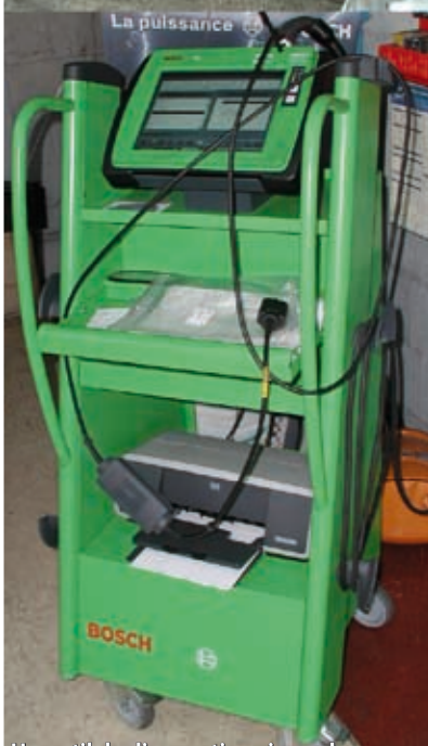
Un outil de diagnostic universel.