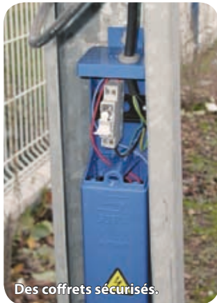
Des coffrets sécurisés.

Coût : 14 500 €, avec une aide de l'État de 1 172 €.