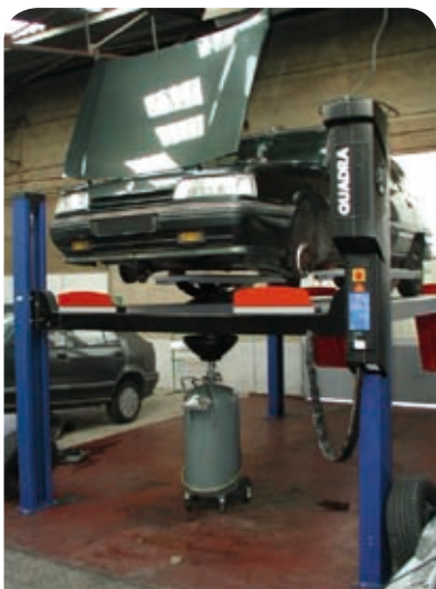
Un pont tout neuf.