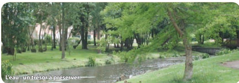
L'eau : un trésor à préserver.