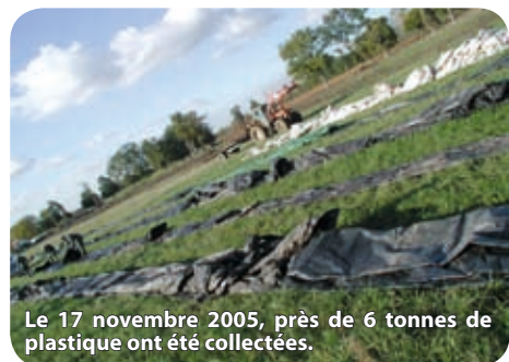
Le 17 novembre 2005, près de 6 tonnes de plastique ont été collectées.

et les films étirables étaient eux aussi acceptés. Résultat : quatre cent kilos de films, deux tonnes de sacs et trois tonnes et demi de bâches