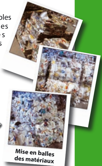
Mise en balles des matériaux