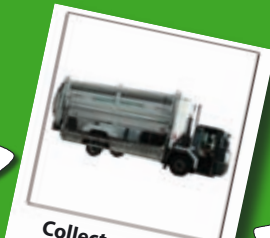
Collecte + tri des matériaux + transport