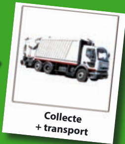
Collecte + transport