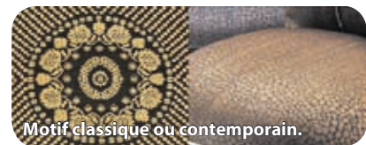
Motif classique ou contemporain.

poraine a été créée qui offre, entre autres, des effets de peau de serpent ou de crocodile très élégants. Portés sur des fauteuils aux lignes actuelles, ces motifs permettent de réaliser des pièces d'ameublement de toute