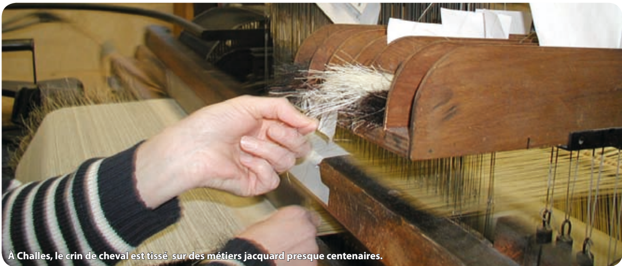
À Challes, le crin de cheval est tissé sur des métiers jacquard presque centenaires.