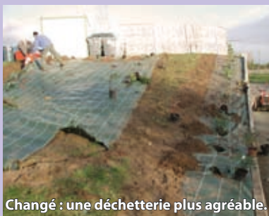
Changé : une déchetterie plus agréable.

■ À Challes, une dalle de béton a été construite afin de placer les conteneurs d'apport volontaire dans l'enceinte de la déchetterie, comme c'est le cas dans les autres déchetteries communautaires. Cet agencement limite les dépôts qui doivent, pour des raisons de