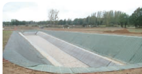
Le bassin « Réserve - Incendie » de La Boussardière.

cours de réalisation, et une dizaine de lots viabilisés sera disponible au second semestre 2006.