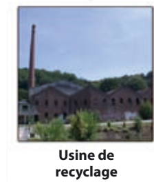
Usine de recyclage