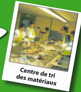
Centre de tri des matériaux