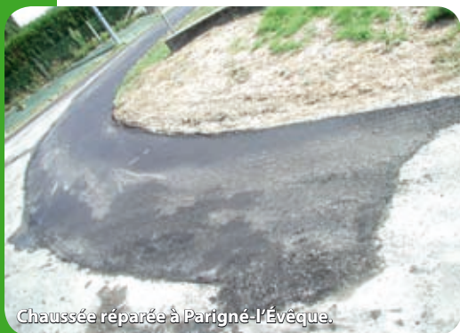
Chaussée réparée à Parigné-l'Évêque.