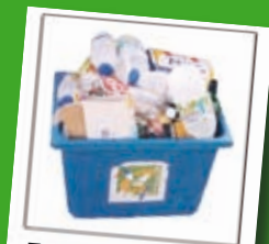
Tri des emballages à domicile