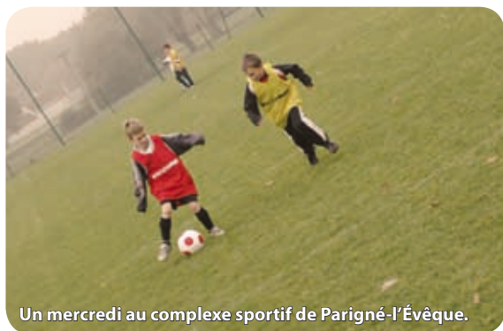
Un mercredi au complexe sportif de Parigné-l'Évêque.