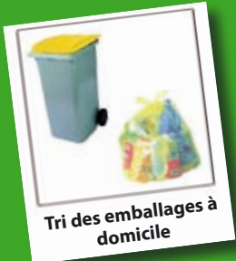
Tri des emballages à domicile