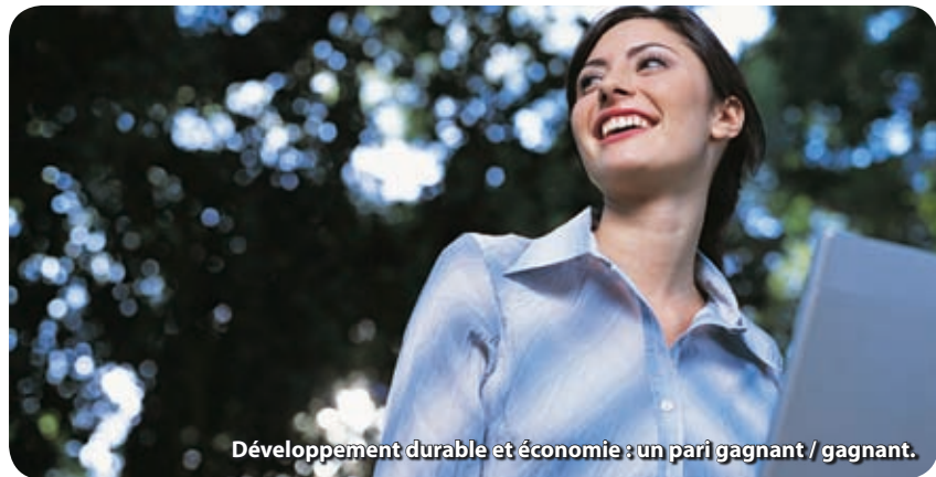
Développement durable et économie : un pari gagnant / gagnant.

Parce qu'il est essentiel pour le développement des territoires que les collectivités territoriales et les entreprises se connaissent mieux, la Communauté de Communes du Sud-Est du Pays Manceau va prochainement organiser des rencontres thématiques avec les chefs d'entreprises locaux. La première du genre sera consacrée au développement durable. Une question d'avenir.