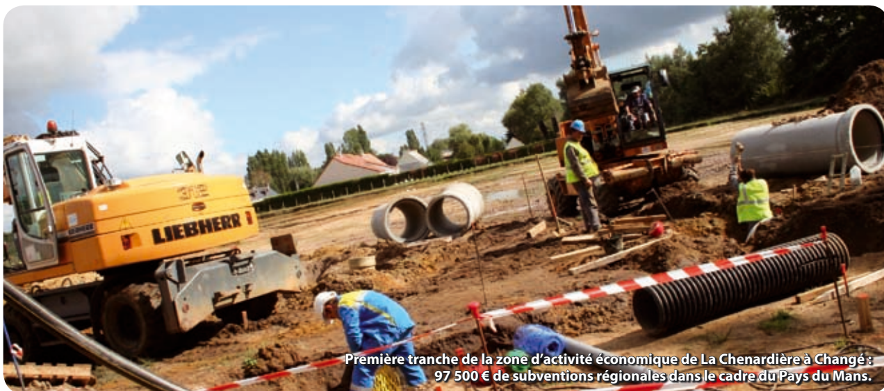
Première tranche de la zone d'activité économique de La Chenardière à Changé : 97 500 € de subventions régionales dans le cadre du Pays du Mans.