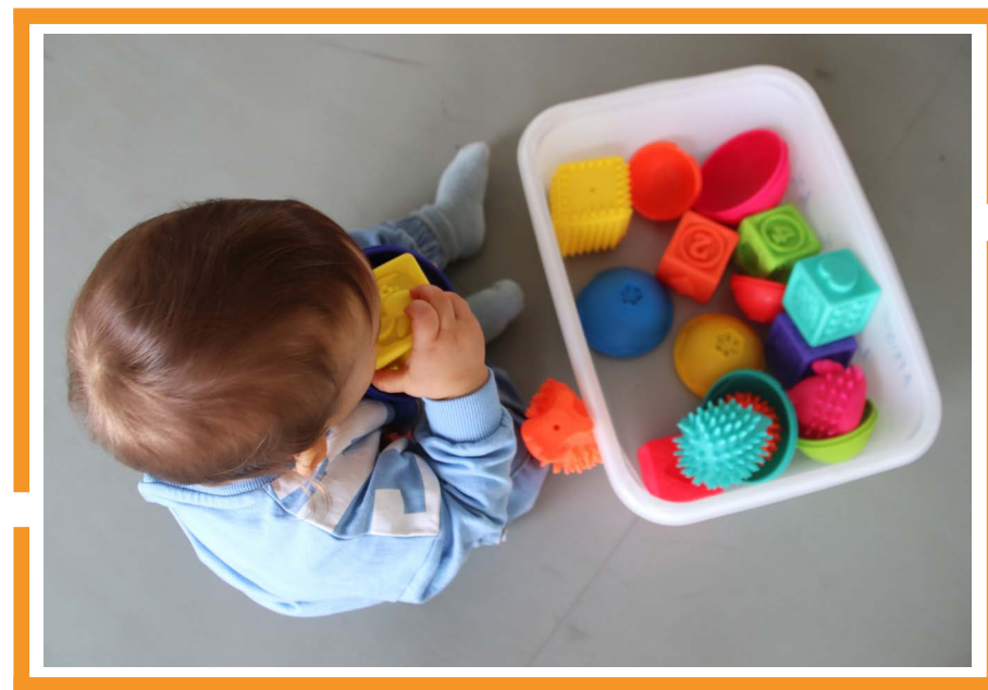
Ateliers de découverte sensorielle - février 2026