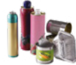
emballages en métal