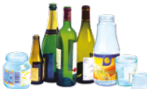
bouteilles, pots, bocaux en verre