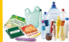
bouteilles, flacons et emballages en plastique