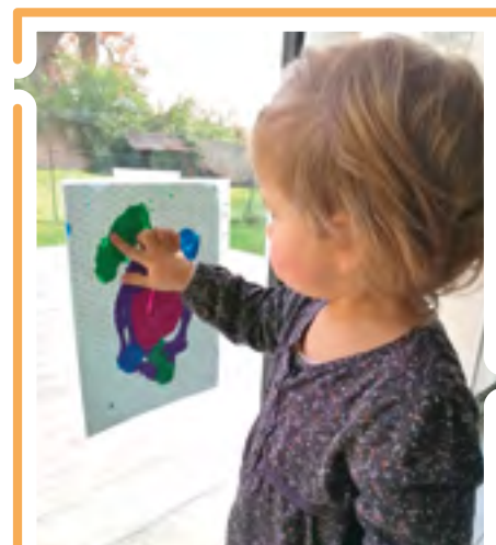
La « peinture propre », un des tutos proposés par le Relais durant le confinement.

En raison de la crise sanitaire, l'année 2020 qui se termine aura été perturbée. Toutefois, nous sommes heureuses de vous annoncer que le Relais Petite Enfance a renouvelé son agrément auprès de la Caisse d'Allocations Familiales pour quatre années supplémentaires. Gage de qualité, cet agrément est aussi un outil permettant de fixer de nouveaux objectifs pour vous être toujours plus utile, comme par exemple la mise en place du prêt de matériel de puériculture. De plus, malgré les confinements successifs, votre Relais a réussi à maintenir le lien avec vous : sorties conviviales à l'Arche de la Nature au mois de juin, reprise des Ateliers Jeux et Rencontres en septembre, et depuis quelques semaines supports d'accompagnement à distance comme les tutoriels vidéo d'activités, les fiches recettes et comptines, le partage d'articles de fond sur le développement du jeune enfant (merci d'ailleurs pour vos retours et vos photos)... Sans oublier ce journal ! La crise nous oblige à être innovant et le Relais du Sud-Est Manceau a, je crois, réussi à relever le défi. Avec en tête un seul objectif : rester à vos côtés dans votre quotidien professionnel quelles que soient les circonstances. Avec l'espoir de vous rencontrer bientôt en personne, je m'associe aux animatrices du Relais et à la responsable du service Animation Jeunesse communautaire pour vous souhaiter de très belles fêtes de fin d'année et mes meilleurs vœux.