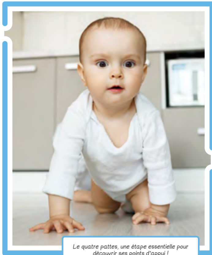
Le quatre pattes, une étape essentielle pour découvrir ses points d'appui !

Motricité libre ne veut cependant pas dire que l'adulte encadrant n'a aucun rôle à jouer, bien au contraire. À lui de tout mettre en œuvre pour créer des conditions propices au développement moteur de l'enfant : lui fournir un espace sécurisé invitant à la découverte, par exemple un tapis de jeu avec quelques jouets légers ; l'habiller avec des vêtements larges et confortables et le laisser pieds nus ; encourager ses tentatives et valoriser ses réussites