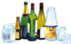
bouteilles, pots, bocaux en verre