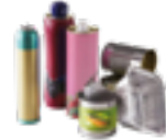
emballages en métal