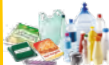
bouteilles, flacons et emballages en plastique