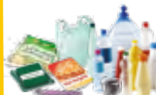
bouteilles, flacons et emballages en plastique